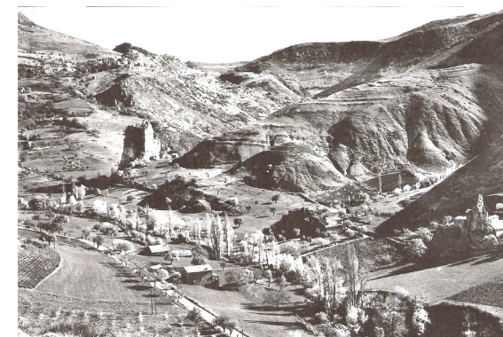
Vue de Barret de Lioure depuis le Quartier du Moulin