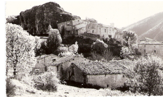
Le bourg en 1969

Expositions à thèmes, œuvres des artistes locaux, concours de boules, repas campagnard animent le village durant 3 jours.